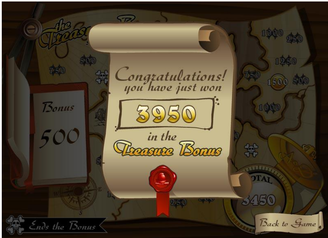
Figura 2: Gráficos de pantalla de bonificación