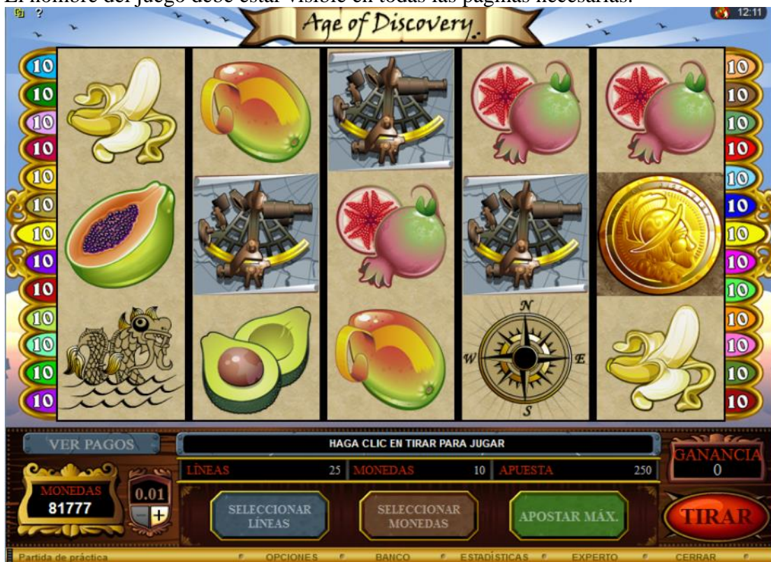
Figura 1: Juego base

El nombre del juego debe estar visible en todas las páginas necesarias.