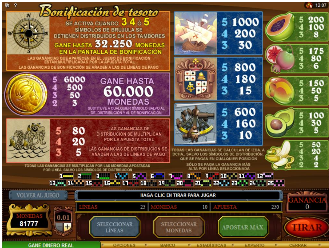
Tabla de premios 1